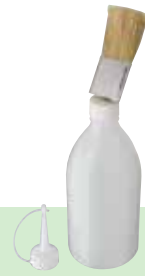
UDB Pinselflasche Bouteille-pinceau UDB